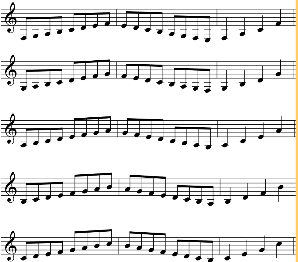
Eufonia - 10801D