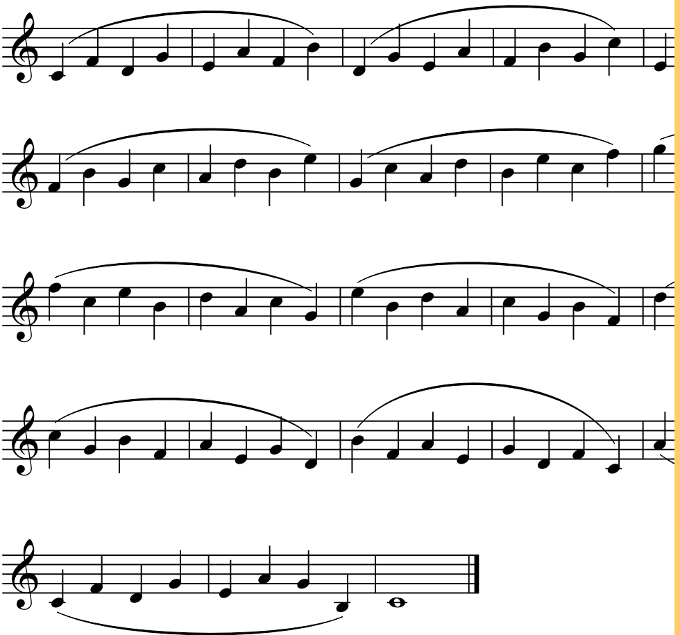
Eufonia - 10801D