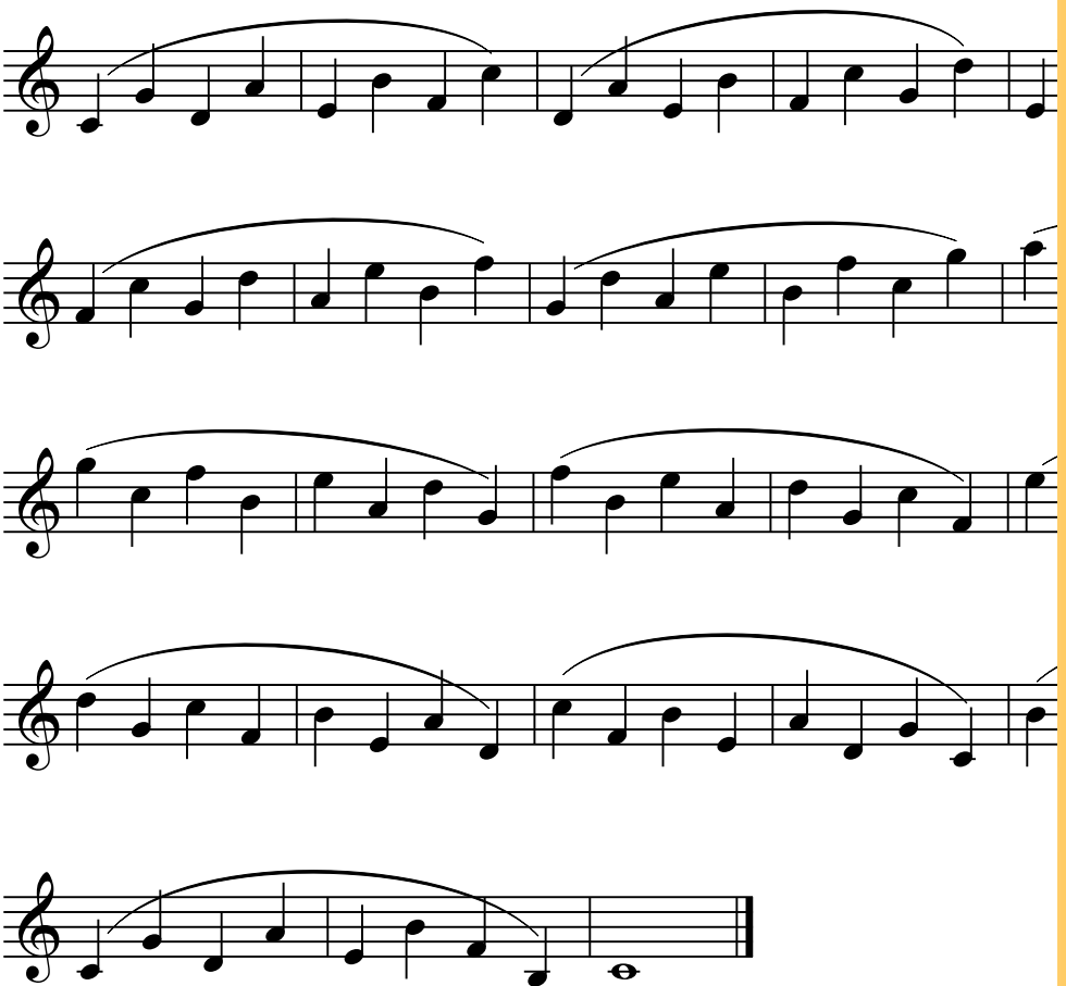
Eufonia - 10801D